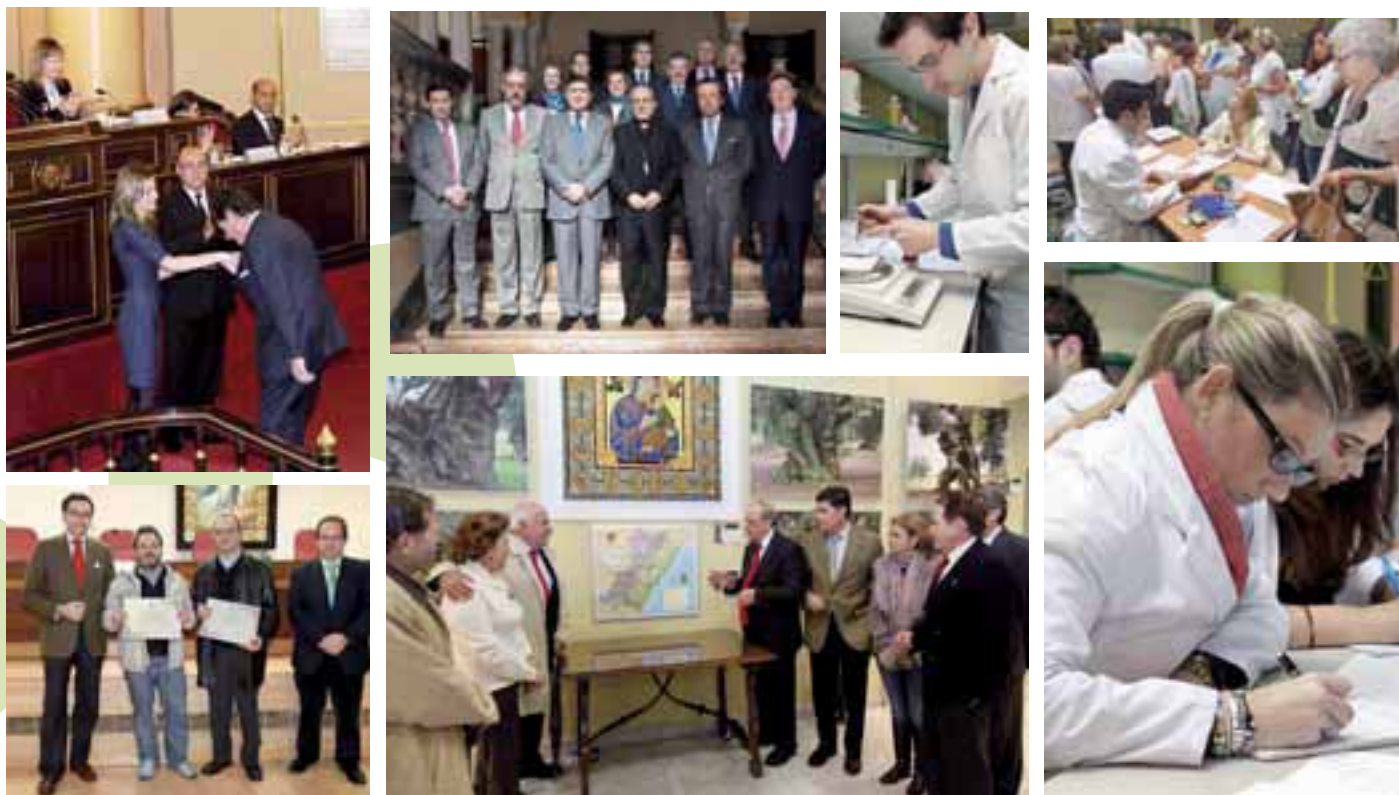
Varias imágenes de actividades y acciones celebradas en 2010.

La Memoria de Responsabilidad Social de 2010 vuelve a acreditar el firme y creciente compromiso del Colegio de Farmacéuticos de Sevilla por seguir mejorando y potenciando tanto los servicios a los colegiados como las actuaciones directas en beneficio de los usuarios de la Farmacia, siempre desde la máxima eficiencia en el uso y gestión de sus recursos pero sin renunciar a ninguno de sus fines fundacionales y de los objetivos relacionados con el nuevo