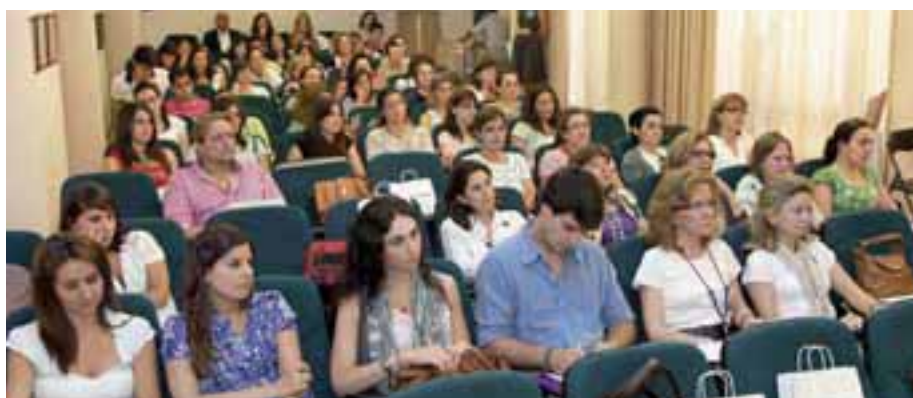
Las actividades de Dermofarmacia congregaron, como se aprecia en la imagen, a gran cantidad de compañeros en el salón de actos.