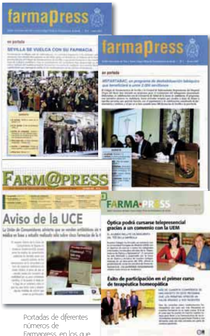
Portadas de diferentes números de Farnapress, en los que se aprecia como ha ido cambiando la imagen gráfica a lo largo de los años.