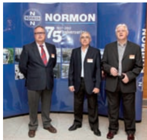
En la imagen, los stands de CECOFAR y NORMON con sus responsables. En el medio, el que representa el proyecto conjunto de Cartera de Servicios del COF Sevilla y CECOFAR.