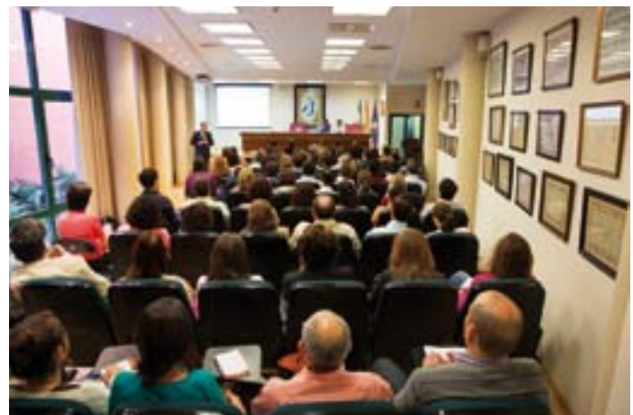
Aspecto del salón de actos, totalmente lleno.