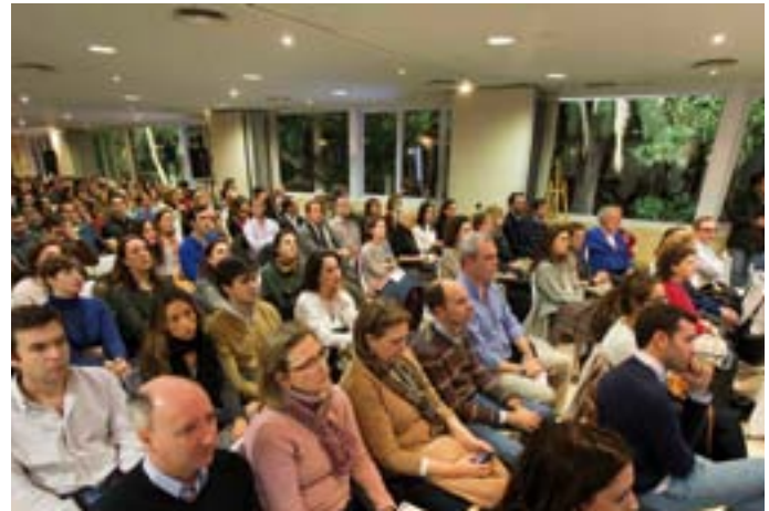
Aspecto que presentaba el auditorio, completamente lleno. Más de 300 compañeros se dieron cita.