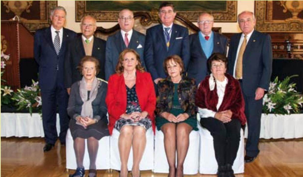
Compañeros con 40 años de colegiación que recogieron su Insignia de Oro, junto al Presidente del Colegio.

Los compañeros que han cumplido 40 y 25 años de colegiación recibieron, respectivamente, las Insignias de Oro y Plata de la Corporación