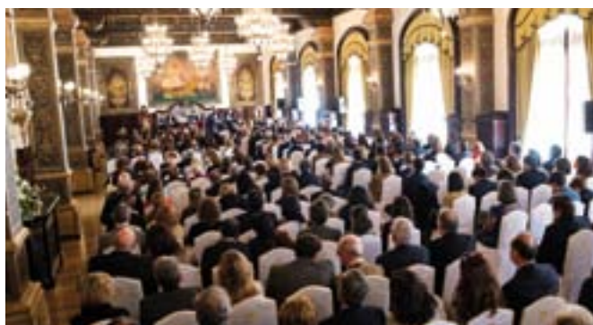
Aspecto del salón, con más de 300 colegiados.