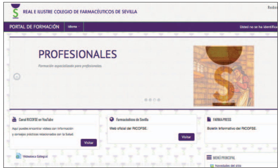
Imagen del Portal del Formación On Line.

Alojado en nuestra web y disponible ya en la dirección portalformacion.farmaceuticosdesevilla.es , el nuevo portal cuenta por tanto con un espacio específico para la formación en Cartera de Servicios, donde se encuentra ya el curso on line sobre Consejo y Gestión Integral