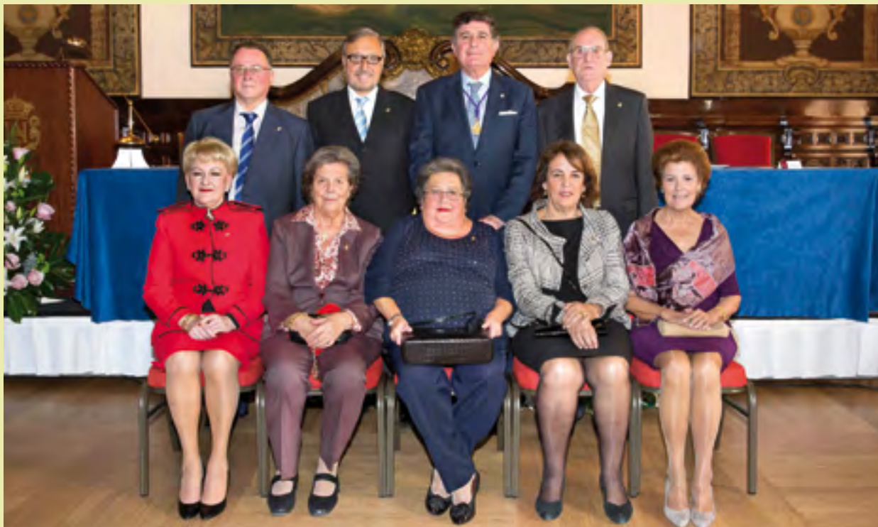
Compañeros con 40 años de colegiación que recogieron su Insignia de Oro, junto al Presidente del Colegio.

Los compañeros que han cumplido los 40 y 25 años de colegiación respectivamente recibieron las insignias de Oro y Plata de la Corporación