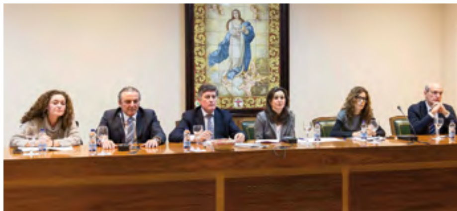
Mesa Redonda Jornadas Enfermedades Raras.

La Fundación Mehuer de nuestro Colegio, junto a la Federación Española de Enfermedades Raras y la Asociación Española de Laboratorios de Medicamentos Huérfanos y Ultrahuérfanos han solicitado en unas jornadas celebradas en nuestra sede colegial (y que llevaban por título 'Hacia una colaboración común en la búsqueda de soluciones en el ámbito de las enfermedades raras en Andalucía') la creación de una plataforma activa y permanente sobre enfermedades raras -en la Junta de Andalucía o en el Parlamento andaluz- que de manera continuada dé cabida a todos los actores involucrados en el ámbito de las patologías de baja prevalencia para alcanzar soluciones efectivas. Según han expuesto los ponentes participantes, las enfermedades raras representan un verdadero reto en términos de salud pública debido a los diversos factores que dificultan su diagnóstico y tratamiento. Por un lado, la ausencia de información y de expertos suficientes hace que la obtención de un diagnóstico sea un proceso largo y complicado —el promedio de tiempo hasta el diagnóstico es de 5 años—. Por otra, contribuye a este retraso que en España existan varias agencias autonómicas e innumera-