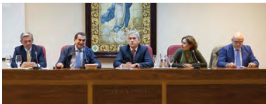
Mesa del Curso de Inspección Farmacéutica.