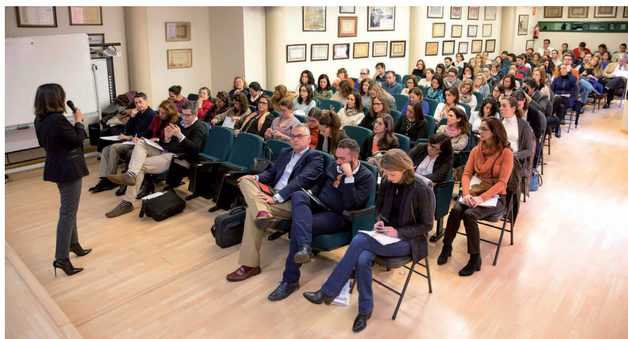
Imagen del Salón de actos completamente lleno.

La segunda parte del curso prosiguió con otro tema de interés capital y sobre el