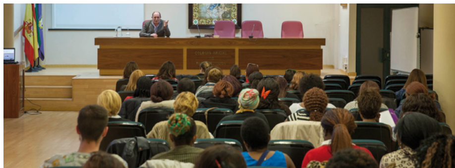
Aspecto de nuestro salón de actos durante la sesión formativa.