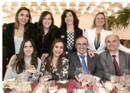
Farmacia Sánchez López.