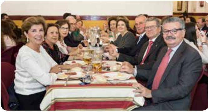
Comisión de la Caseta junto a amigos y familiares.