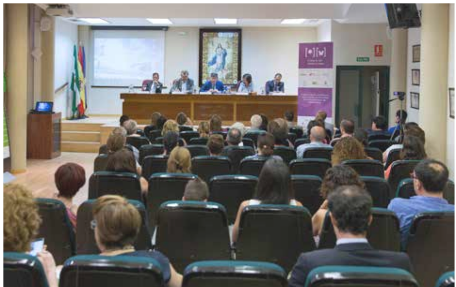
Numerosos compañeros participaron en el acto de presentación de la Campaña Frena el Sol, frena el lupus.