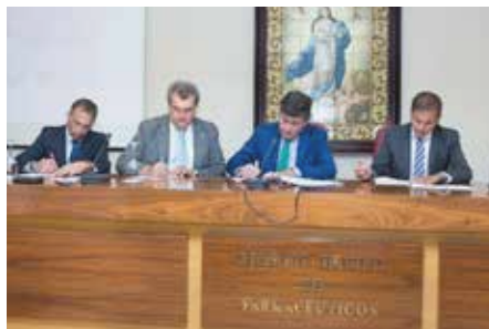
Imagen de la firma.

La campaña 'Frena el sol, frena el lupus' tiene como objetivo facilitar a los pacientes de lupus el acceso, a través de las farmacias participantes, a fotoprotectores de calidad (Factor de Protección Solar de nivel ultra, +50) a la mitad de su precio, pues la aplicación de estos productos es fundamental para evitar el agravamiento del lupus y la aparición de brotes. De esta iniciativa se podrán