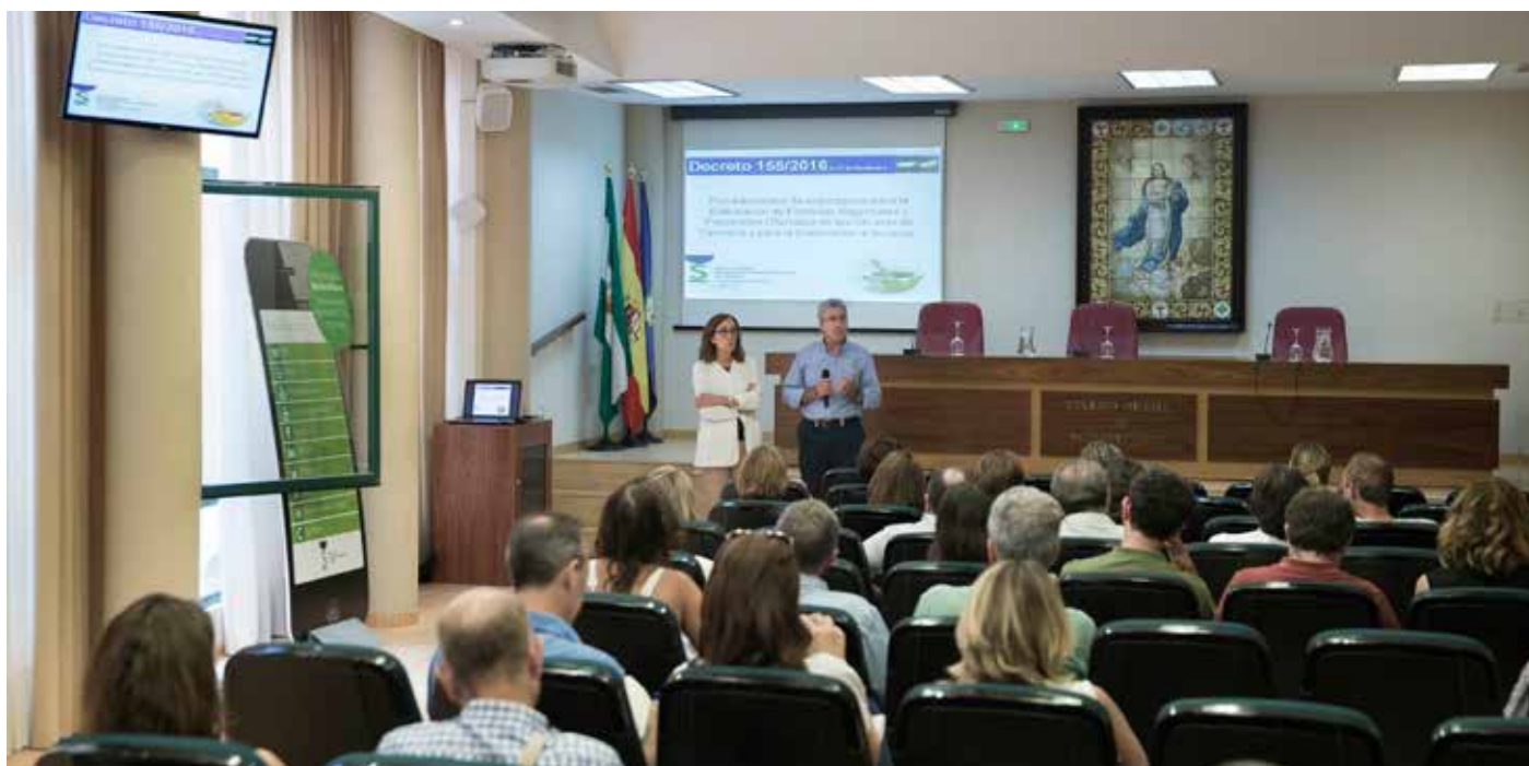
Imagen de una de las sesiones informativas sobre el Decreto 155/2016 celebradas en nuestro Colegio.