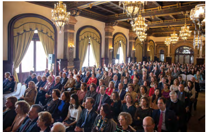
Un año más, los compañeros abarrotaron el salón del Alfonso XIII.