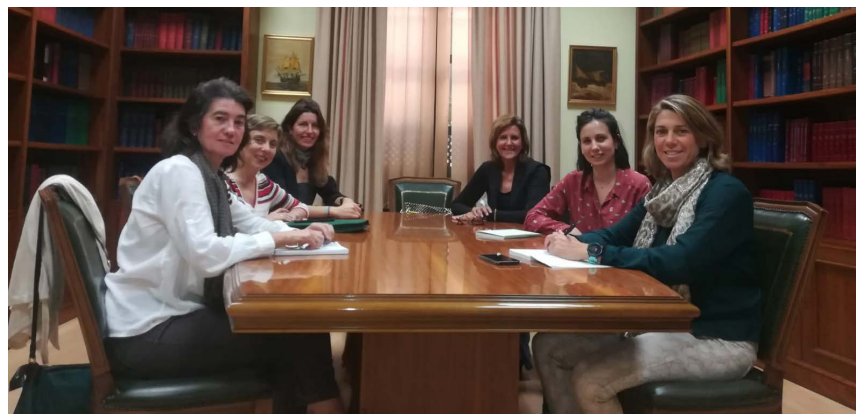
Grupo de trabajo de Nutrición.

Adjúntate es una propuesta 360º dirigida a enriquecer nuestro currículum, mejorar la capacidad para impartir formación, aprender a realizar estudios científicos, acceder a becas o compartir experiencias profesionales con otros compañeros en congresos y jornadas