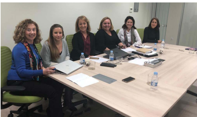
Técnicos del CONGRAL y miembros de la Junta de Gobierno y staff técnico de nuestro Colegio.

Dentro de esta implicación colegial con los programas del Consejo, encontramos la próxima acción de HazFarma, un proyecto global