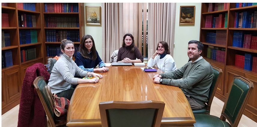
Grupo de trabajo de Salud Pública.