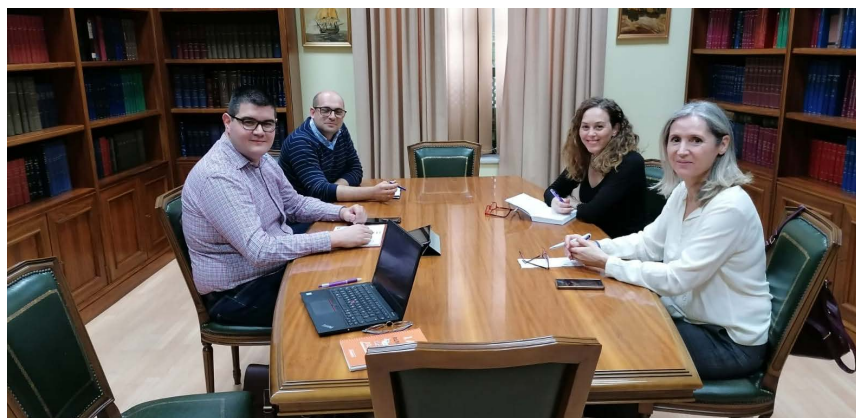
Grupo de Gestión de Oficina de Farmacia.