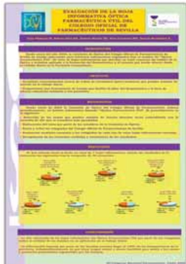
5.- Evaluación de la Hoja Informativa Óptica 'Farmacéutica útil' del Colegio Oficial de Farmacéuticos de Sevilla. Comisión de Óptica.