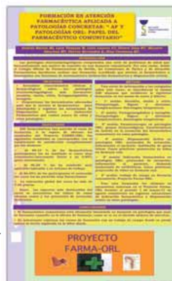
3.- Formación en Atención Farmacéutica aplicada a Patologías Concretas: "AF y Patologías ORL: papel del Farmacéutico Comunitario". Comisiones de Óptica y Atención Farmacéutica.