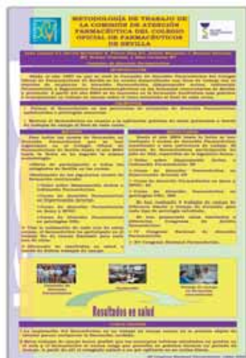
4.- Metodología de Trabajo de la Comisión de Atención Farmacéutica del Colegio Oficial de Farmacéuticos de Sevilla. Comisión de Atención Farmacéutica.