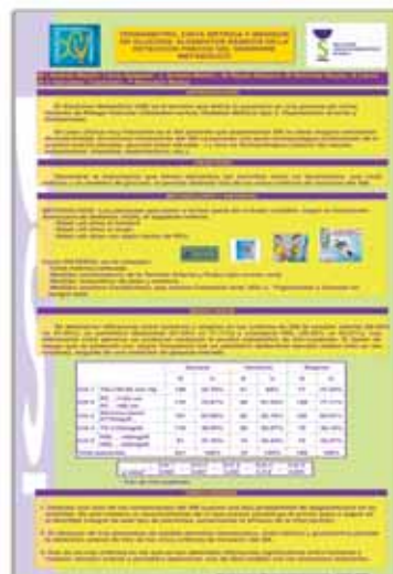
6.- Tensiómetro, Cinta métrica y Medidor de Glucosa: elementos básicos en la detección precoz del Síndrome Metabólico. Grupo Génesis.