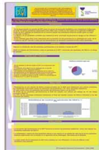
7.- Valoración de la incidencia del Seguimiento Farmacoterapéutico (SFT) desarrollado por Farmacéuticos en Farmacia Comunitaria en un grupo de pacientes con medicación anti-diabética a través de la medición de hemoglobina glicosilada (hba1c). Grupo Génesis.