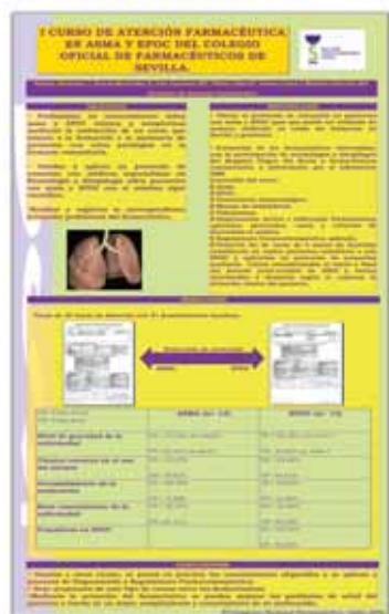
1.- I Curso de Atención Farmacéutica en Asma y EPOC del Colegio Oficial de Farmacéuticos de Sevilla. Comisión de Atención Farmacéutica.