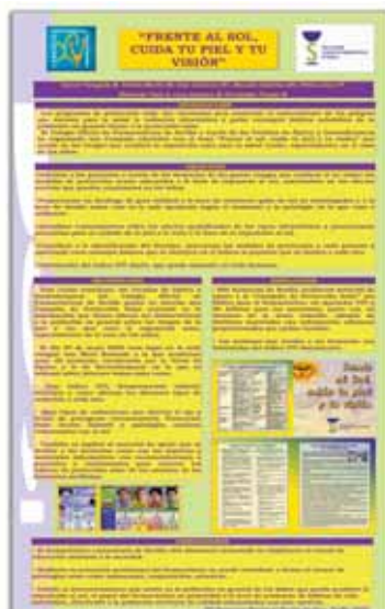
2.- Campaña educativa con el lema "Frente al sol, cuida tu piel y tu visión". Vocalías de Óptica y Dermofarmacia.