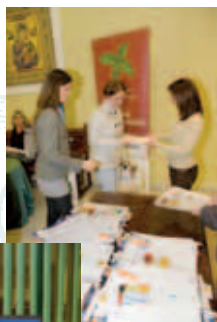
Conferencia sobre Antihistamínicos

A primeros de marzo se celebró en el Colegio una interesante conferencia sobre "Indicaciones y seguridad de los Antihistamínicos Anti-H1", realizada en colaboración con Laboratorios Uriach. ■