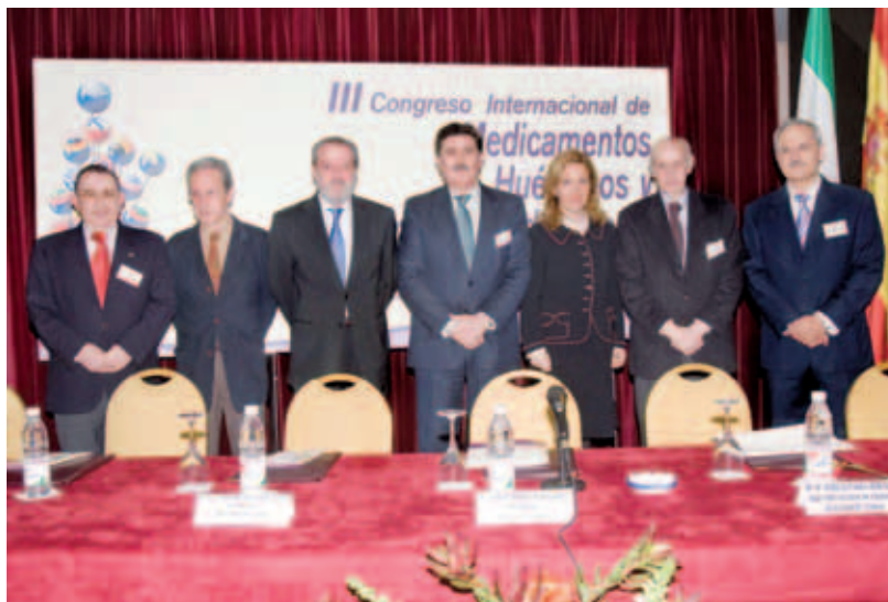
Mesa Inaugural del III Congreso Internacional de Medicamentos Huérfanos y Enfermedades Raras, celebrado en 2007

El reconocimiento parte de Ediciones Mayo supone para el Colegio un gran estímulo y satisfacción que lo anima a seguir trabajando de forma decidida en su apoyo a los afectados por enfermedades raras. Un apoyo que encuentra su manifestación más notable en la colaboración en la organización de las tres ediciones de Congresos Internacionales de