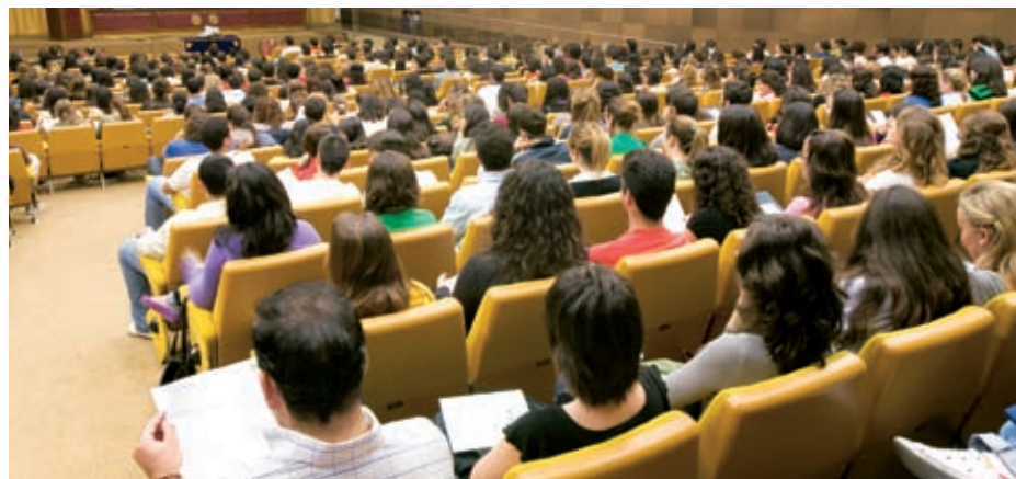
Aspecto que presentaba el Aula de Grados, con más de 600 alumnos.

El Aula Magna de la Facultad de Medicina acogió la última edición de estas jornadas, la octava, patrocinada por Abbot, y celebrada el pasado mes de octubre con la presencia de más de 600 alumnos. Una participación multitudinaria que acredita el acierto de una iniciativa concebida para que futuros médicos y Farmacéuticos, estudiantes de ambas carreras en la Universidad de Sevilla, acudan a una cita común en torno a la receta médica, documento en el que converge el espacio profesional de unos y de otros, la prescripción y la dispensación.