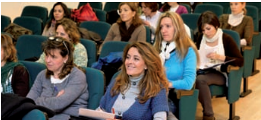
Asistentes al curso de Seguimiento Nutricional.

una duración de 32 horas lectivas, repartidas en 17 sesiones en un horario de 20.30 a 22.30, pensado para favorecer la compatibilidad con el horario de Farmacia. El curso se compone de cinco módulos: el primero, introductorio; el segundo, sobre enfermedades de base nutricional; el tercero, sobre patología del aparato digestivo; el cuarto, sobre obesidad y trastornos de la conducta alimentaria; y el quinto, sobre alteraciones nutricionales en otras pato-