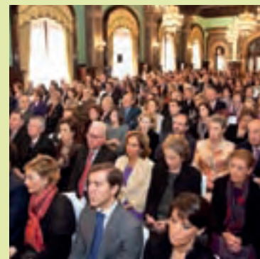
Aspecto del Salón de Actos.