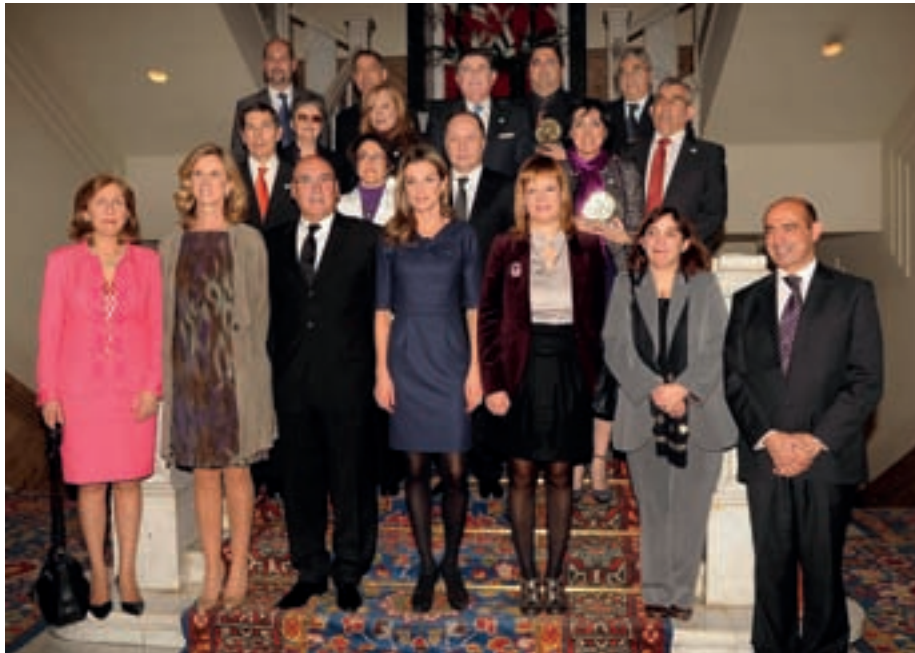
Imagen de los premiados con las Ministras de Sanidad, Ciencia e Innovación y el presidente del Senado.

La Federación Española de Enfermedades Raras (FEDER) le ha concedido este premio por el impulso del Colegio al conocimiento público de estas patologías