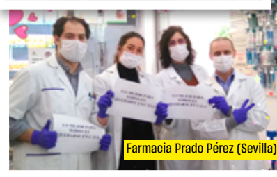
Farmacia Prado Pérez (Sevilla)