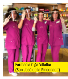
Farmacia Olga Villalba (San José de la Rinconada)