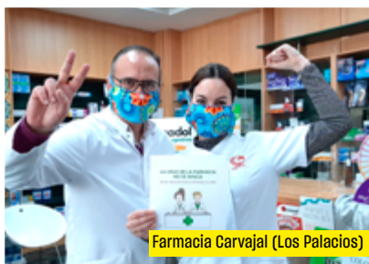
Farmacia Carvajal (Los Palacios)