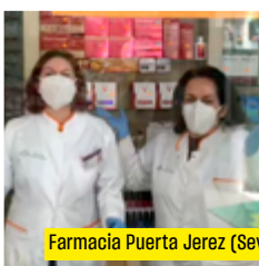
Farmacia Puerta Jerez (Sevilla)