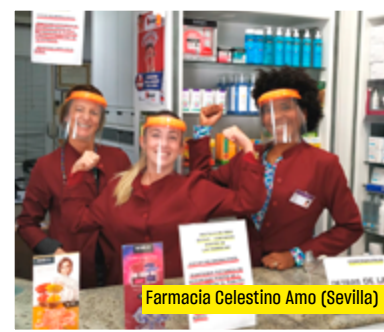
Farmacia Celestino Amo (Sevilla)