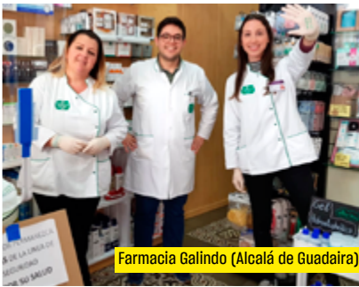
Farmacia Galindo (Alcalá de Guadaíra)