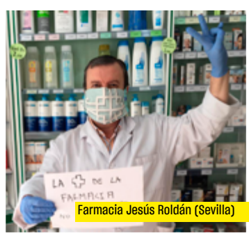
Farmacia Jesús Roldán (Sevilla)