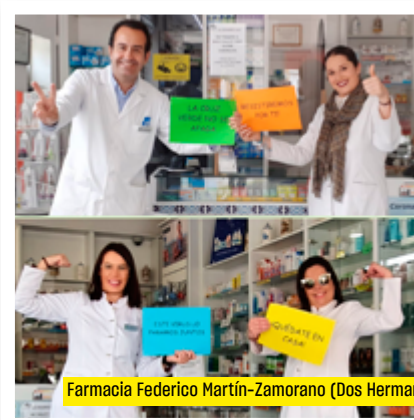
Farmacia Federico Martín-Zamorano (Dos Hermanas)