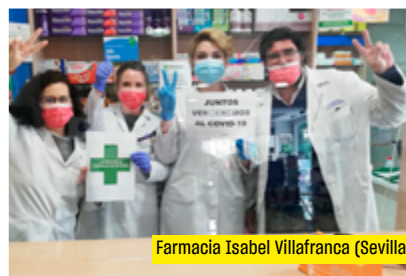
Farmacia Isabel Villafranca (Sevilla)