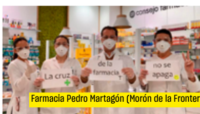
Farmacia Pedro Martagón (Morón de la Frontera)