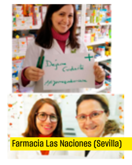
Farmacia Las Naciones (Sevilla)