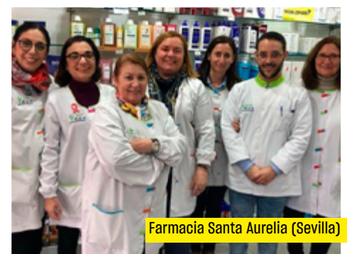
Farmacia Santa Aurelia (Sevilla)