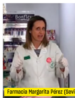
Farmacia Margarita Pérez (Sevilla)