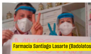
Farmacia Santiago Lasarte (Badolatosa)