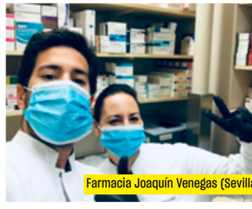
Farmacia Joaquín Venegas (Sevilla)