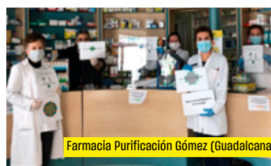
Farmacia Purificación Gómez (Guadalcanal)