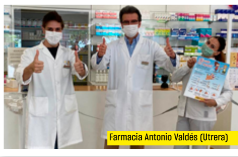
Farmacia Antonio Valdés (Utrera)