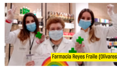
Farmacia Reyes Fraile (Olivares)