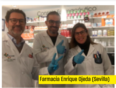
Farmacia Enrique Ojeda (Sevilla)