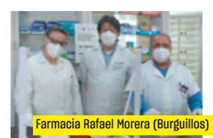
Farmacia Rafael Morera (Burguillos)