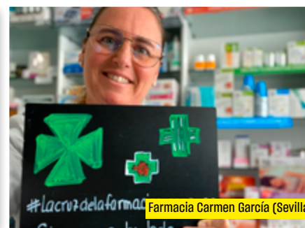
Farmacia Carmen García (Sevilla)