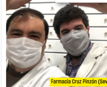
Farmacia Cruz Pinzón (Sevilla)